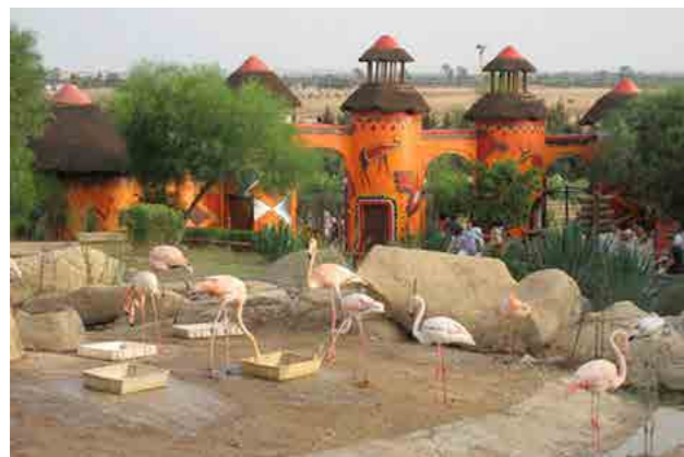
Le Friguia Park, à une heure de Sousse.