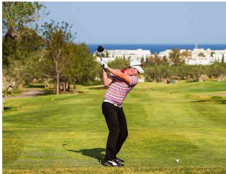
Le golf El Kantaoui, duquel on peut voir la mer.