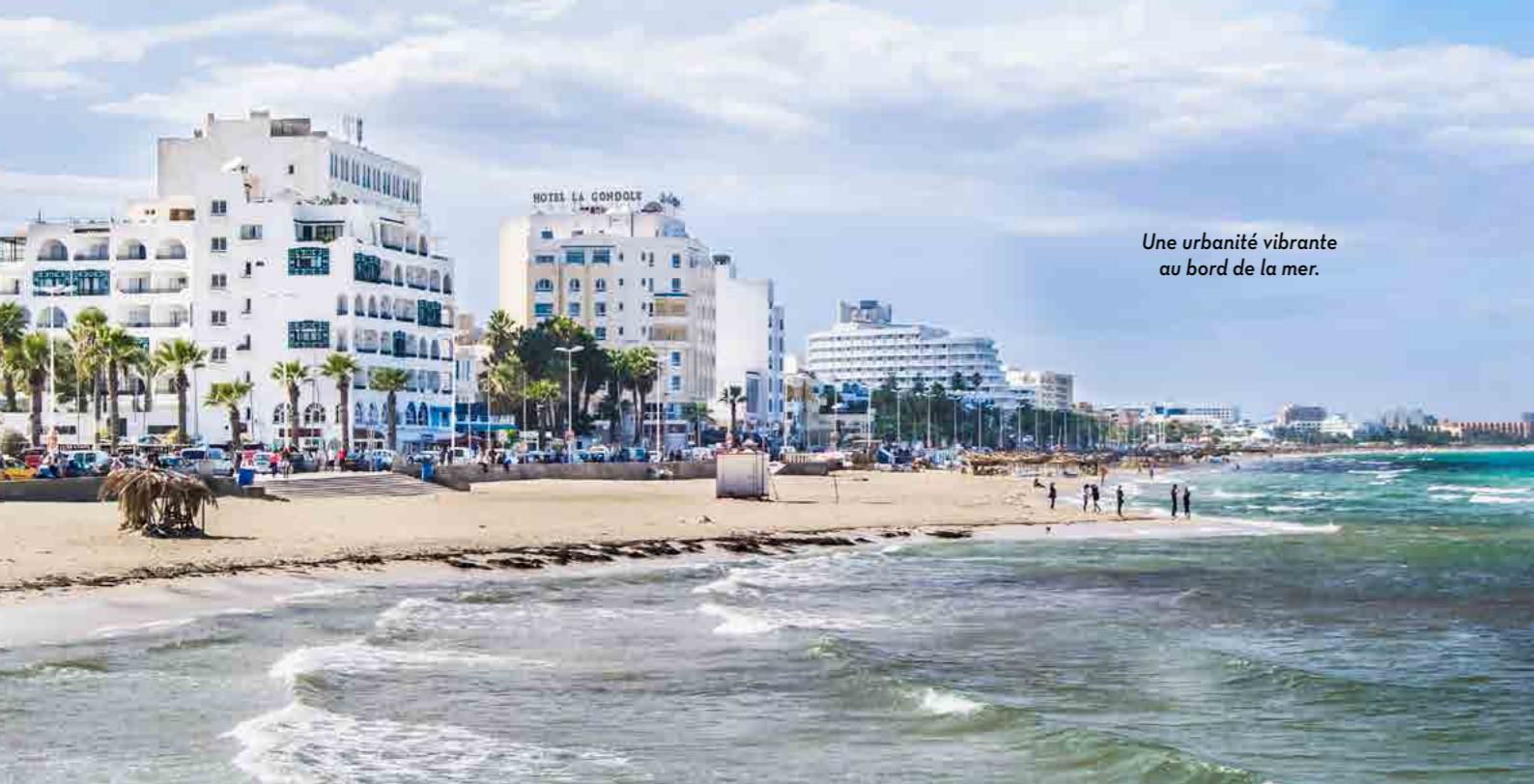
Une urbanité vibrante au bord de la mer.